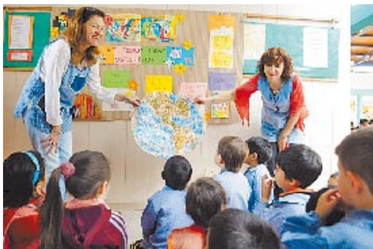
Más. Se incorporarán 100 mil alumnos a las escuelas.

El Gobierno nacional promulgó ayer la ley que establece la obligatoriedad de la sala de 4 años. Así, a partir de 2015 el sistema educativo formal tiene 14 años de escolaridad obligatoria en la Argentina. Según estimaciones oficiales, la nueva norma exigirá que se incorporen a las escuelas alrededor de 100 mil niños. Actualmente el 81,5 por ciento de los chicos de esa edad están dentro del sistema educativo.